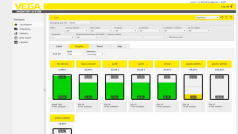
VEGA Inventory System - Hébergement sur serveur VEGA