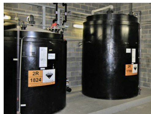
Cuve de stockage de produits chimiques acides ou alcalins.

Le site britannique de Belvedere, près de Londres, abrite une de ces installations d'incinération des déchets. On y trouve quatre cuves en polypropylène contenant de l'hydroxyde de sodium (soude caustique). Chaque produit est stocké dans une grande cuve en attendant leur transfert vers de plus petites cuves, utilisées pour le dosage et la neutralisation. Initialement, toutes les cuves avaient été fournies avec un système de mesure bon marché (mesure par bullage), qui était tombé en panne à cause de la corrosion et des dépôts. Les boîtiers des appareils laissaient échapper des vapeurs et des gaz. De plus, le système manquait de fiabilité, de précision et de sécurité.