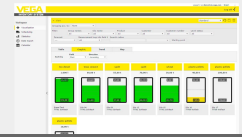
VEGA Inventory System - servizio di hosting VEGA