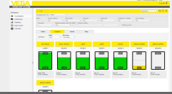
VEGA Inventory System - servizio di hosting VEGA