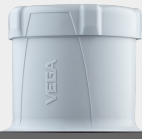
VEGAPULS Air 42