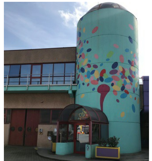
Hauptsitz von ACS Dobfar in Tribiano bei Mailand.