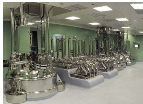
Füllstandsensoren kontrollieren und steuern die unterschiedlichsten Produktmengen.

Auf den Hauptlagertanks, die eine Höhe von 8 bis 15 m und einen Durchmesser von ungefähr 2 bis 3 m aufweisen, sind eine ganze Reihe an Füllstandsensoren von VEGA eingebaut. Dort kontrollieren und steuern sie die unterschiedlichsten Produktmengen. In den Tanks werden neben den Rohstoffen auch Lösemittel und Säuren gelagert. „Wir stellen gleich mehrere Anforderungen an die Geräte. Vor allem müssen alle installierten Sensoren eine ATEX-Zulassung vorweisen. Erst kürzlich haben wir auch damit begonnen, die Druckmessgeräte nach SIL zu standardisieren“, erklärt Bruccoli.