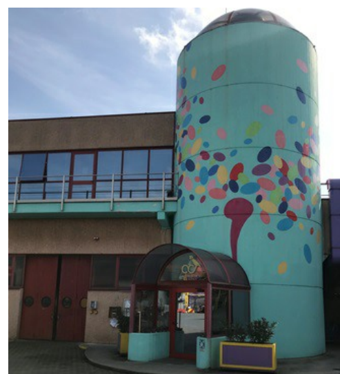
Le siège d'ACS Dobfar à Tribiano, près de Milan.