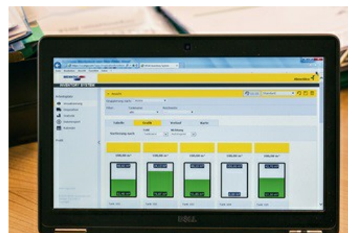
Gestion des stocks avec VEGA Inventory System.