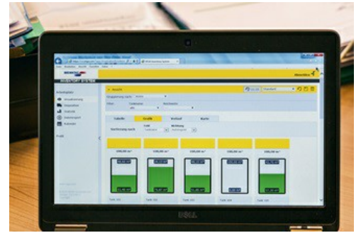
Gestione delle scorte di magazzino con VEGA Inventory System.

Grazie al VEGA Inventory System , i responsabili della divisione Logistica e Tecnica assumono il ruolo di amministratori del sistema: possono integrare comodamente altre sedi nel sistema e accordare diritti di accesso anche ai clienti di Brenntag. In base agli andamenti dei livelli in un lungo intervallo di tempo è possibile valutare lo sviluppo dell'attività e abbozzare previsioni per il futuro. Nel lungo periodo, il flusso automatizzato di informazioni o.re dunque vantaggi per l'intera catena di fornitura: crea trasparenza per il fornitore e sicurezza di approvvigionamento per l'acquirente.