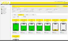
VEGA Inventory System - servizio di hosting VEGA