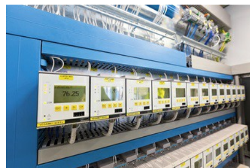
Armadio delle apparecchiature di comando con elaboratori VEGAMET 624 per il parco serbatoi interrati per solventi.

Per un'azienda come Brenntag è estremamente importante monitorare con sicurezza, ovunque e in ogni momento, le scorte di sostanze chimiche. Un contenimento delle scorte determina una riduzione dei costi. Anche qui era necessaria una soluzione su misura per l'applicazione, economica e facile da utilizzare. La scelta è caduta sul VEGA Inventory System (VIS). Tramite il software, la tecnica di misura di serbatoi e sili comunica direttamente sia con la logistica in loco, sia con la sede centrale. Il VIS non accede solamente ai dati di misura attuali, ma anche a dati relativi ai consumi passati, quantità di ordinazione ottimali e obiettivi di pianificazione futuri.