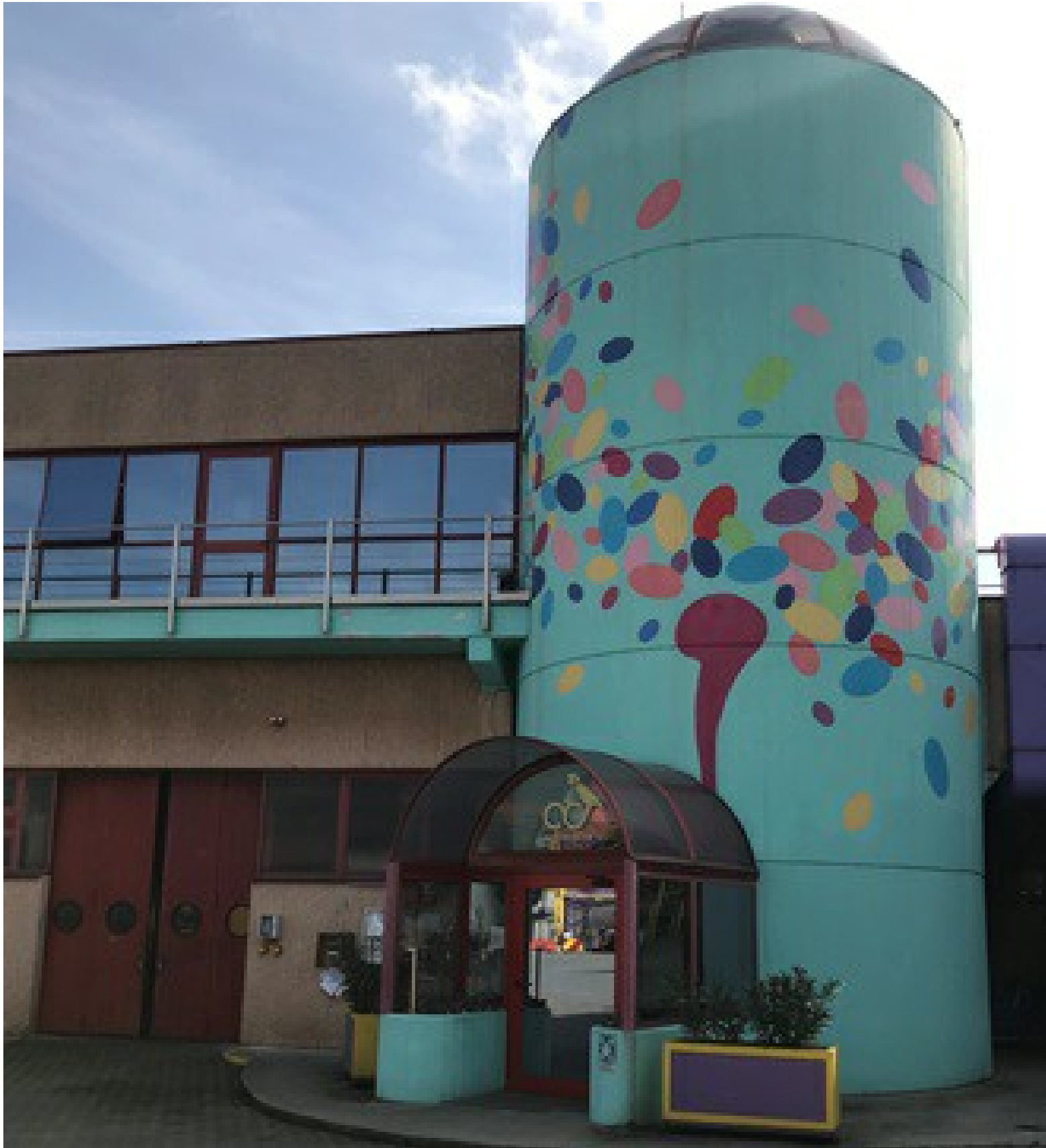
Le siège d'ACS Dobfar à Tribiano, près de Milan.