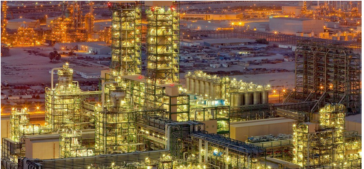
L'installation de production de polyéthylène de Linde à Al-Jubayl, en Arabie saoudite.