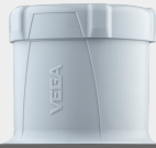
VEGAPULS Air 42