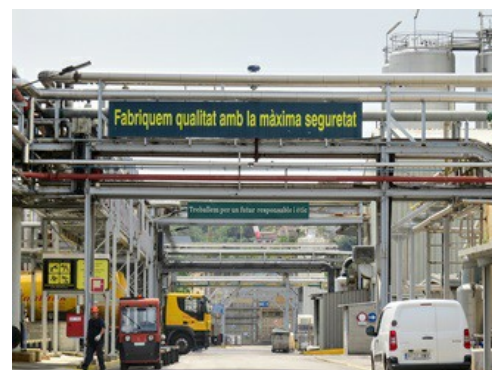
Le site de Croda Ibérica SA à Fogars de la Selva (Barcelone).

Croda Ibérica reconnaît être satisfait des procédés et voies de mesure fonctionnant, avec fiabilité, depuis plusieurs années. Depuis plus de dix ans, l'entreprise travaille en partenariat avec VEGA Espagne. Sur l'ensemble de l'usine, on trouve environ 200 capteurs de toutes sortes. Il y a notamment des capteurs de pression , des capteurs radar à ondes guidées , divers détecteurs de niveau pour les liquides et les solides, ainsi que des capteurs de pression différentielle .