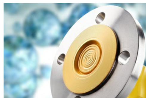
Protection contre la diffusion : membrane de mesure revêtue.

Pour nos cellules de mesure de pression en métal, nous proposons aussi en option un revêtement en or ou en or-rhodium. C'est le mode de protection contre la diffusion, si la cellule de mesure n'est pas sèche.