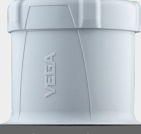
VEGAPULS Air 42