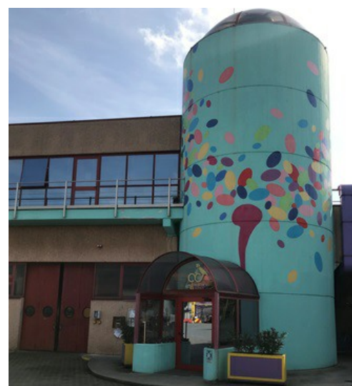
Sede de ACS Dobfar en Tribiano, cerca de Milán.