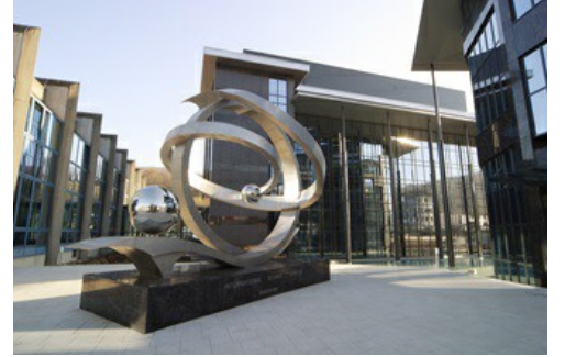
CARBOGEN AMCIS AG'nin İsviçre Bubendorf'taki şirket merkezidir.

Kişiselleştirilmiş ilaçlara ve kalitesinin eksiksiz bir şekilde kanıtlanmasına yöneltilen talep gün geçtikçe artmaktadır. Talep edilen yenilikleri yerine getirenler genellikle araştırmaları sürdüren küçük şirketlerdir. Bu şirketler, proseslerini ve onay yöntemlerini esnek bir şekilde yapılandırır, çalışma adımlarını ve masraflarını standartlaştırma yoluyla düşürürler. CARBOGEN AMCIS AG şirketinde VEGABAR 80 serisi kullanılıyor. Çünkü yüksek performanslı bu basınç ölçüm konventörleri, geniş ölçüm aralıkları ve seramik CERTEC® ölçüm hücresi sayesinde fermantasyondan filtrasyona, temizleme işlemlerine kadar biyo proseslerinin tüm taleplerine cevap vermektedir.