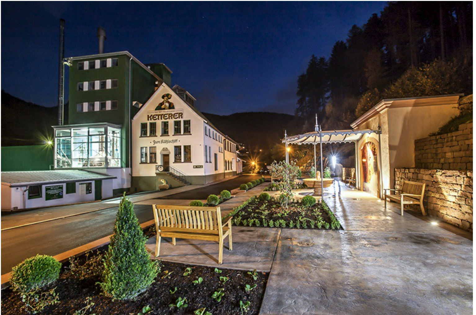
Außenfassade der Brauerei Ketterer in Hornberg.