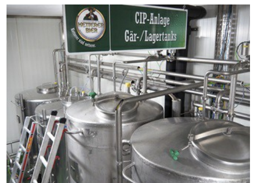
Weitere Druckmessumformer kommen im CIP-Tank zum Einsatz.

Vor über 20 Jahren wurde man auf VEGA aufmerksam. Für ein Trebersilo wurde eine Füllstandmessung eingebaut. Schritt für Schritt kamen im Laufe der Jahre neue Messstellen dazu. Vor allem die steigenden Hygieneanforderungen bei den Tanks forcierte die Messtechnikausrüstung. Alle Gär- und Lagertanks wurden nach und nach umgebaut, um diese besser reinigen zu können. Heute kommen VEGA-Sensoren an vielen Stellen im Werk zum Einsatz, z. B. in den CIP-Anlagen, im Brauwassertank, in den Gär- und Lagertanks sowie im Gärkessel im Sudhaus. Dabei dienen die Sensoren als Überfüllsicherung, unterstützen bei der genauen Bestandsmessung, übernehmen die Dosierung der Mischgetränke und die gesamte Prozesssteuerung. Die räumliche Nähe zu VEGA schätzt Vogt sehr.