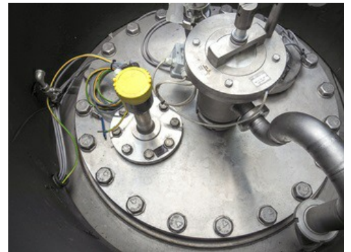
Das Radarfüllstandmessgerät VEGAPULS 64 übernimmt die Inhaltsmessung.

Beim letzten Umbau wurde ein neuer Puffertank für Mineralwasser installiert. Auch hier hat ein VEGAPULS 64 die Bestandskontrolle übernommen. Da das Brauwasser Qualität und Geschmack bei der Bierherstellung verantwortet, hatten die Hornberger schon immer ein besonderes Auge darauf. Vor Jahren entdeckten sie in einem verschütteten Stollen im Wald oberhalb Hornbergs eine neue Quelle. Dieses besonders weiche Wasser war von der Qualität so gut, dass es sich mittlerweile unter dem Namen „Hornberger Lebensquell“ längst einen eigenen Namen gemacht hat und deutschlandweit vertrieben wird. Es ist inzwischen zum zweiten Standbein der Familienbrauerei geworden.