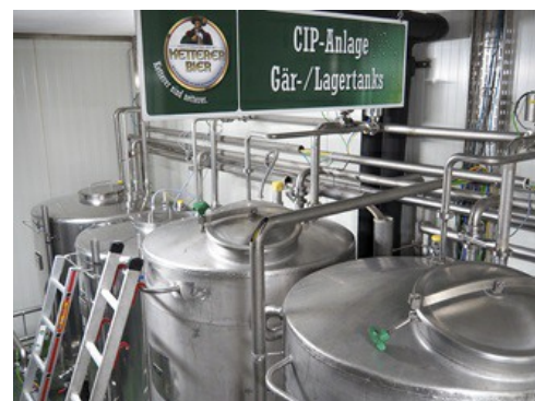
trasduttori di pressione impiegati nell'impianto CIP.

La collaborazione con VEGA è iniziata oltre 20 anni fa con l'installazione di una misura di livello in un silo per la raccolta del sedimento. Nel corso degli anni i punti di misura sono aumentati, soprattutto in seguito all'introduzione di severi standard igienici per i serbatoi. Tutti i serbatoi di fermentazione e stoccaggio sono stati riallestiti progressivamente per facilitarne la pulizia. Oggi nello stabilimento sono installati numerosi sensori VEGA, per es. negli impianti CIP, nel serbatoio dell'acqua impiegata per la birrificazione, nei serbatoi di fermentazione e stoccaggio e nella caldaia della sala di cottura. I sensori sono impiegati come protezione di troppo pieno, per la misura delle scorte, il dosaggio di miscele e l'intero controllo del processo. Vogt apprezza anche la prossimità geografica di VEGA.