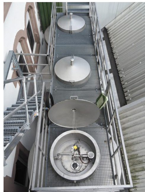
lo strumento di misura di livello radar VEGAPULS 63 installato su uno dei serbatoi di stoccaggio.