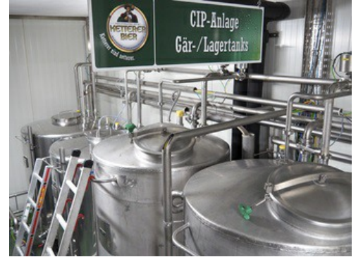
CIP tankında basınç ölçüm transmitterleri kullanılıyor.