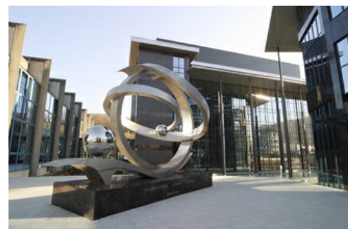
De hoofdvestiging van CARBOGEN AMCIS AG staat in Bubendorf, Zwitserland.

De vraag naar gepersonaliseerde geneesmiddelen en de eisen aan een volledig traceerbare kwaliteit stijgen. De benodigde innovaties worden vaak aangewakkerd door de kleinere, onderzoeksgerichte ondernemingen, die hun processen en goedkeuringsprocedures flexibel vormgeven en zowel arbeid als kosten door middel van standaardisering terugdringen. Bij CARBOGEN AMCIS AG gebruiken ze de VEGABAR Serie 80 . Want de druktransmitters voldoen dankzij hun grote meetbereik en de keramische CERTEC®-meetcel aan de eisen van de bioprocessen, van de fermentatie en filtratie tot en met de zuivering.